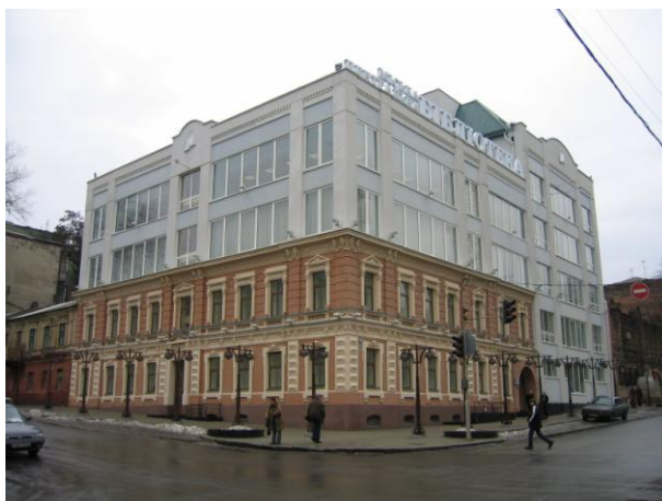
Дніпропетровська Центральна міська бібліотека вул. Леніна, 23

Ксерокопії текстів матеріалів можна замовити в читальних залах бібліотеки.