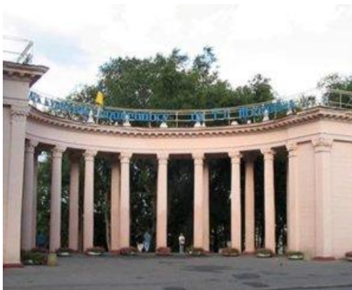
Дніпропетровський парк культури та відпочинку імені Т.Г. Шевченка

Кавун, М.Э. Сады и парки в истории Екатеринослава-Днепропетровска. Книга 1. Парк имени Т.Г. Шевченко / М.Э. Кавун . - Днепропетровск: «Герда», 2009.- 144 с.