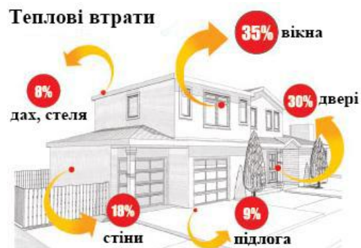
Рис. 1 - Схема теплових втрат