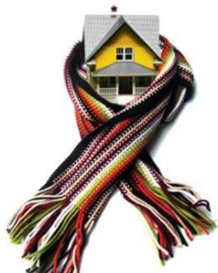
Рис. 4 – Збережи тепло!

З настанням холодів питання теплоізоляції встає гостріше. Але як утеплити двері на зиму, адже саме вони захищають нас від вулиці?