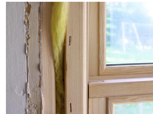
Рис. 3 - Утеплення вікон

www.znayyak.org/yak-utepliti-vikna-na-zimu/