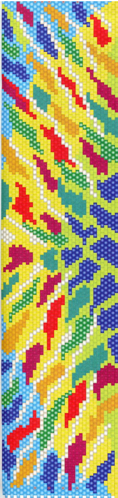
Схема № 2